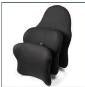
6 verschiedene Höhen und 3 verschiedene Breiten