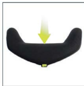
Konturstärke von max. 7.5 – 10 cm je nach Rückengrösse